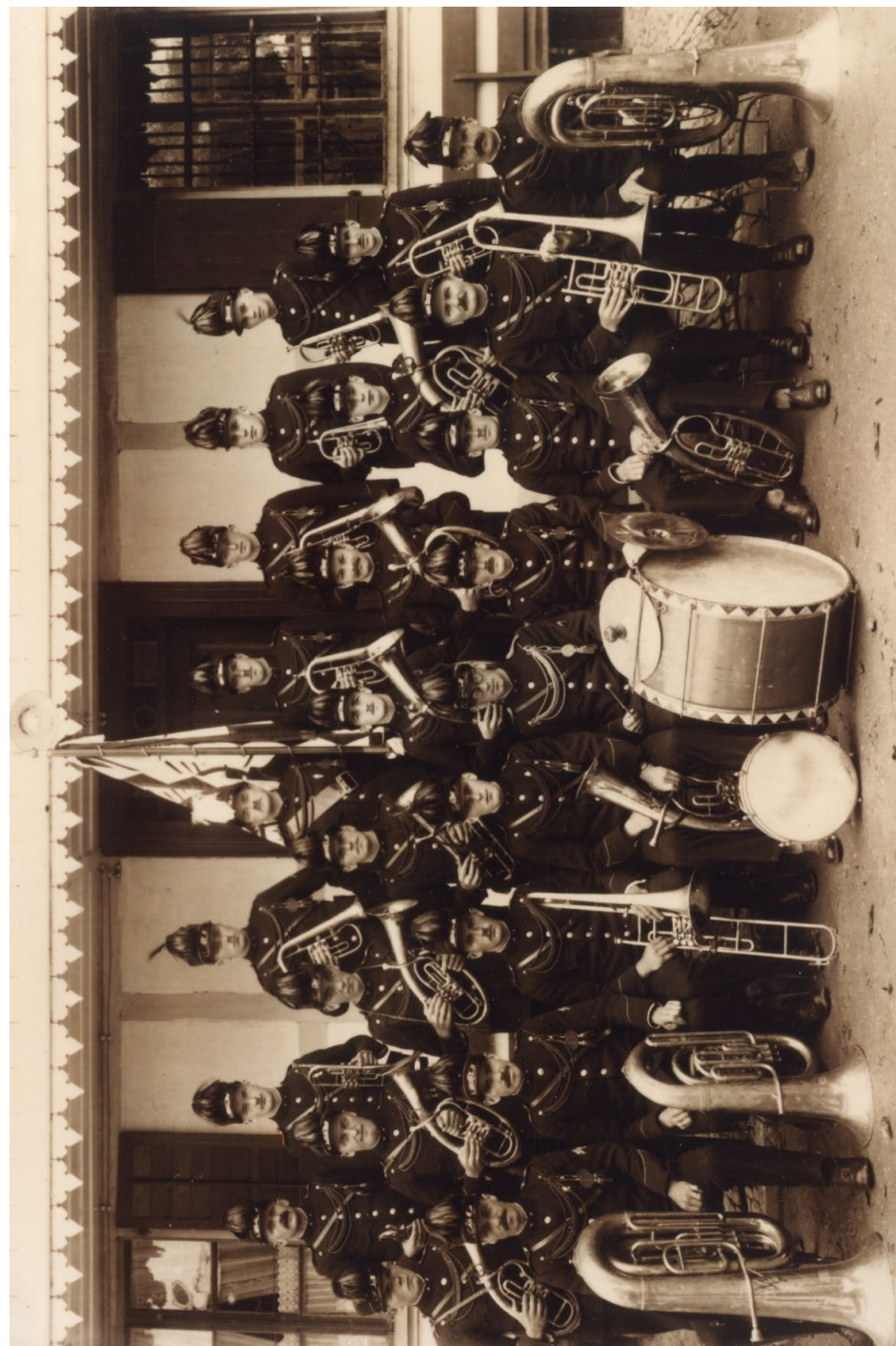
Musikgesellschaft Ueberstorf 1930